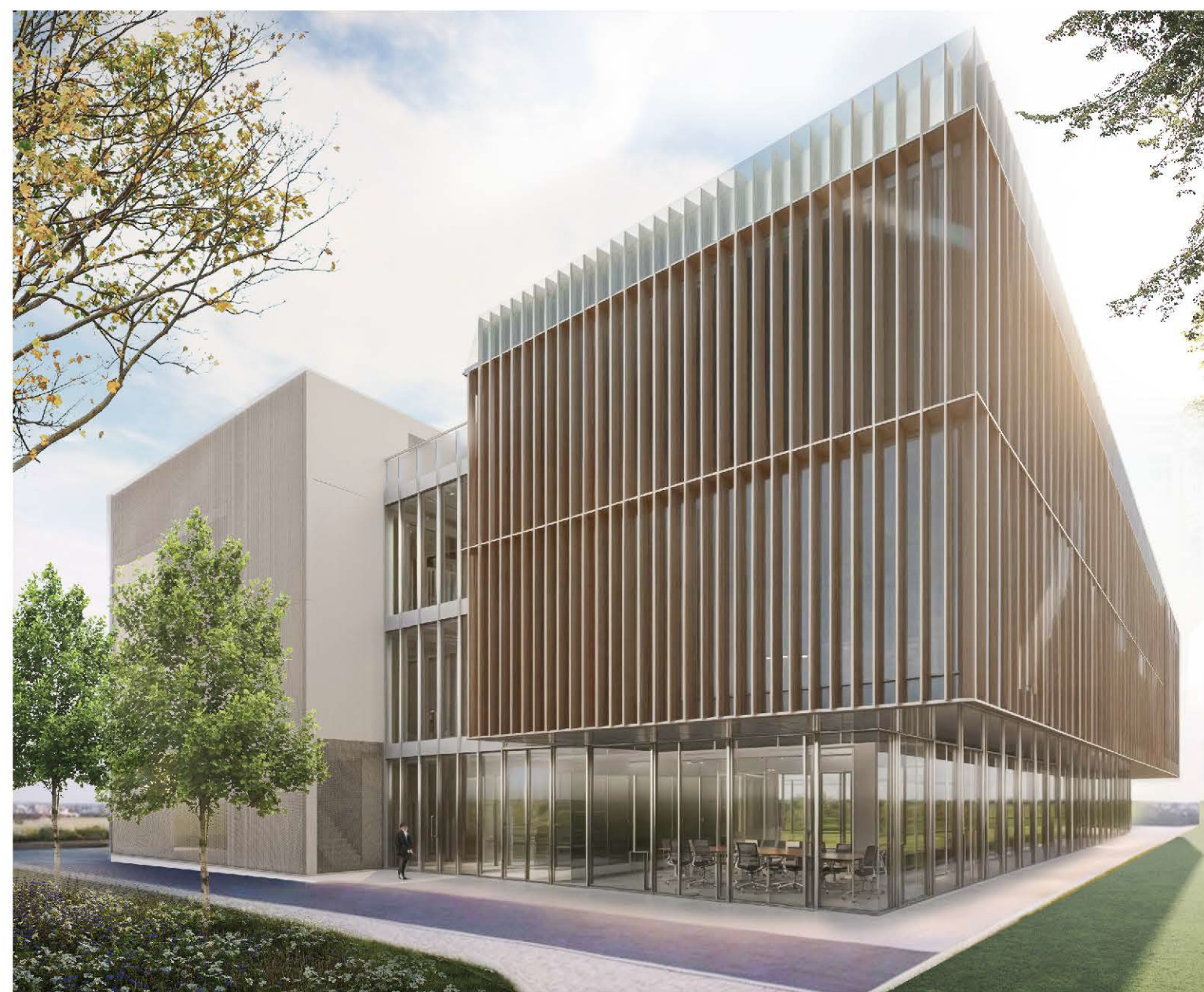
Vista esterno - Lato sud