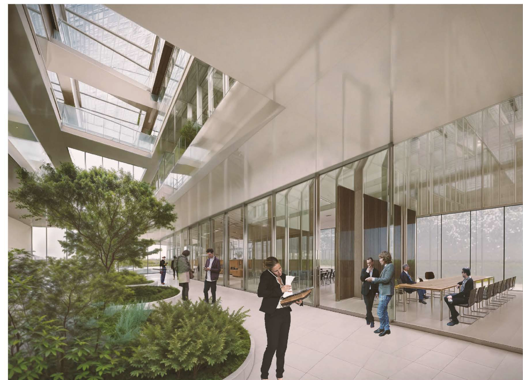
Vista interno - Forum