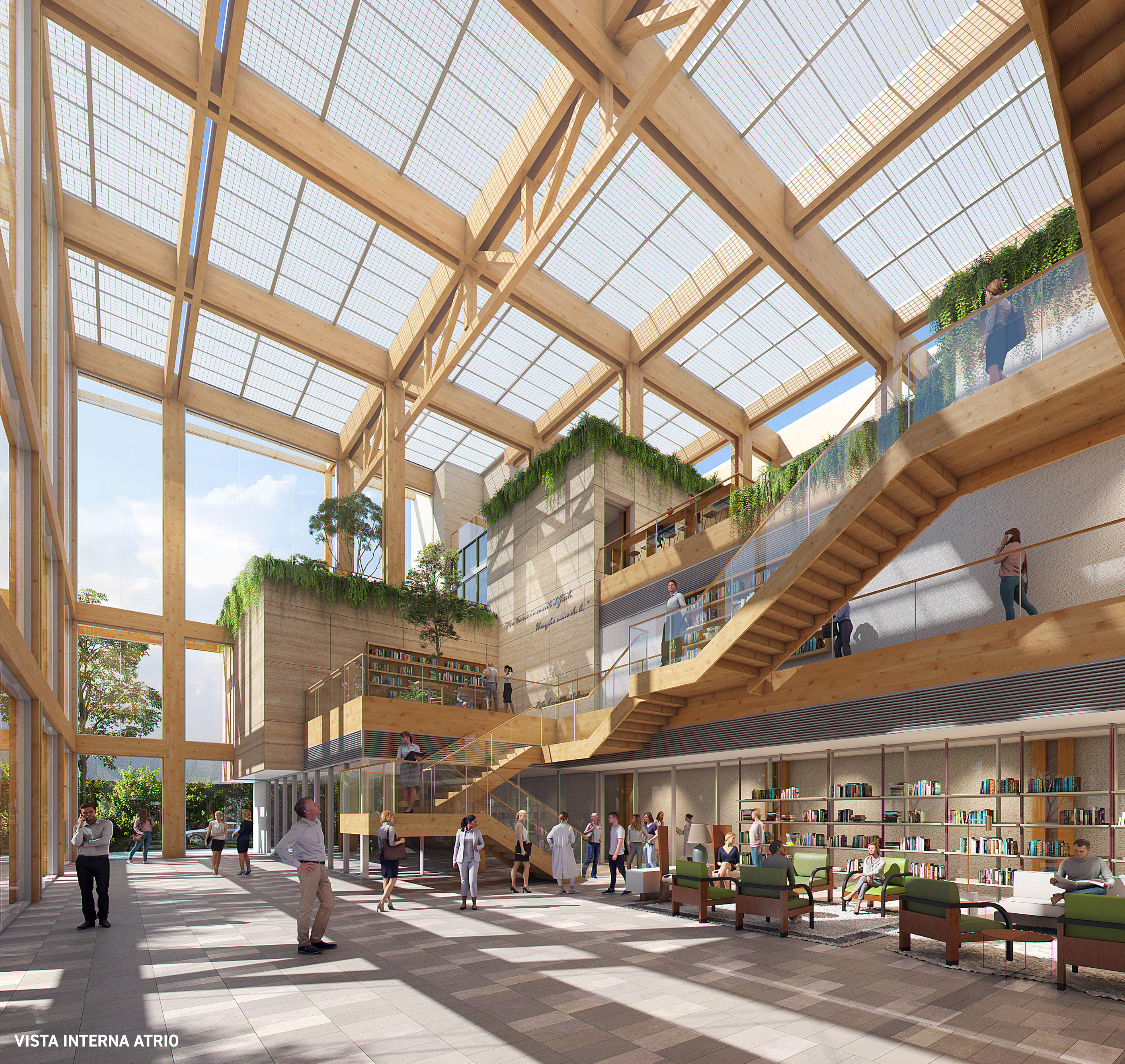
VISTA INTERNA ATRIO