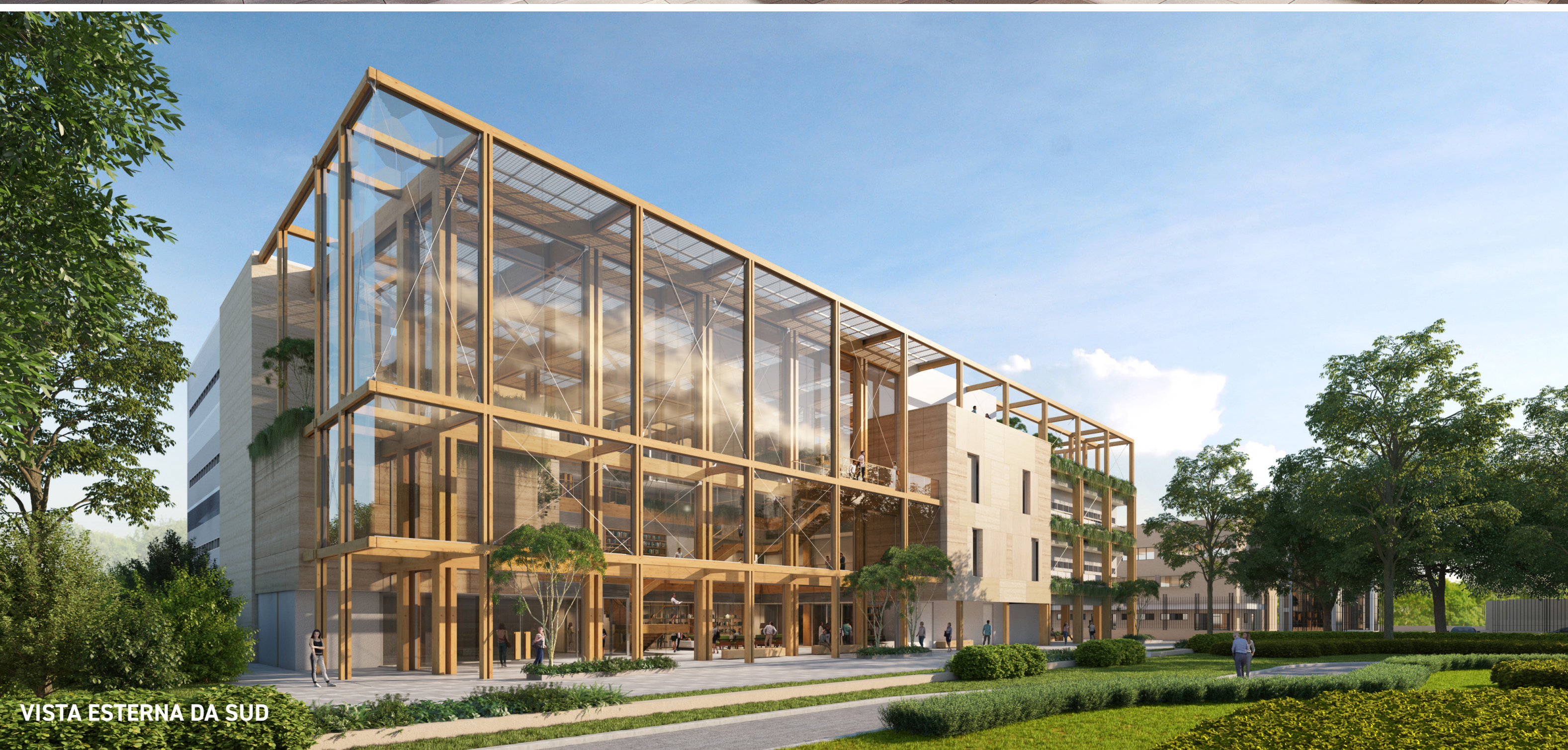
VISTA ESTERNA DA SUD