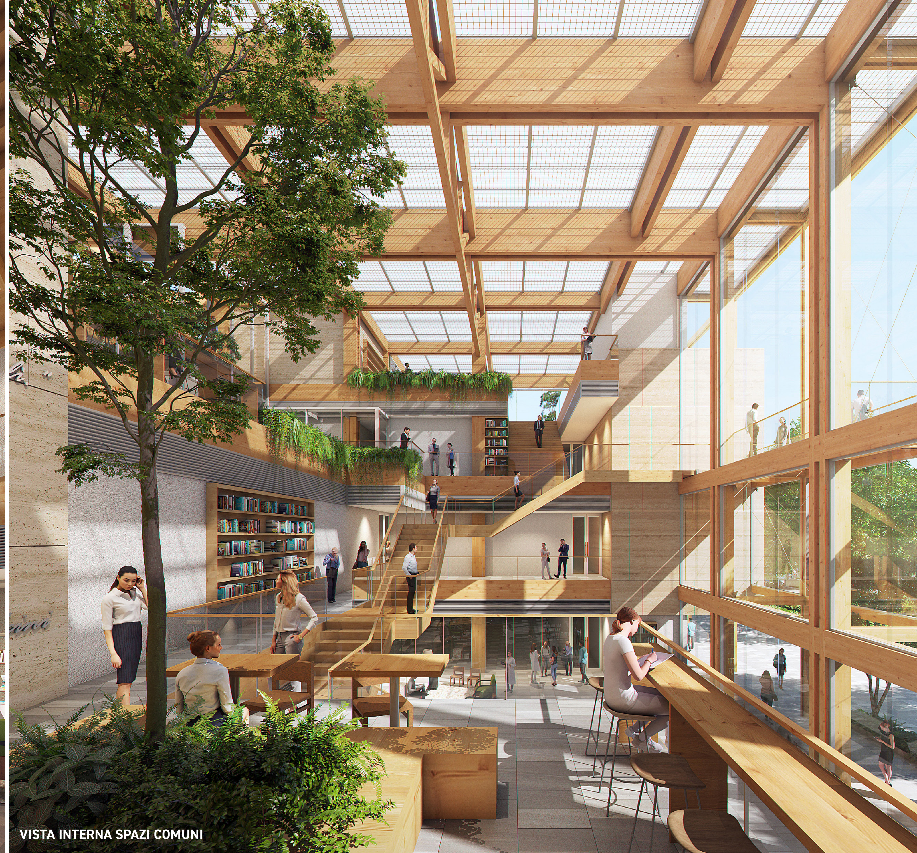
VISTA INTERNA SPAZI COMUNI