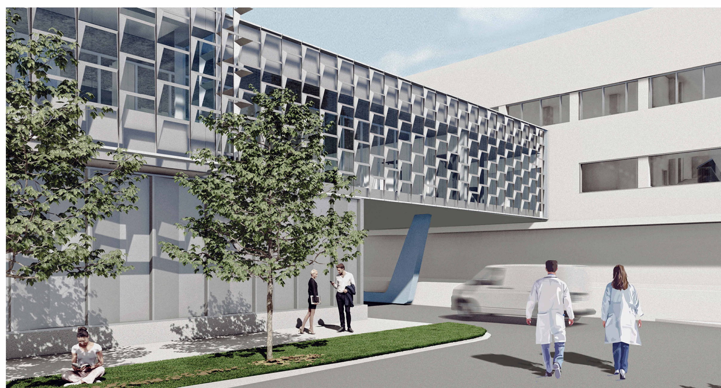
PONTE DI COLLEGAMENTO