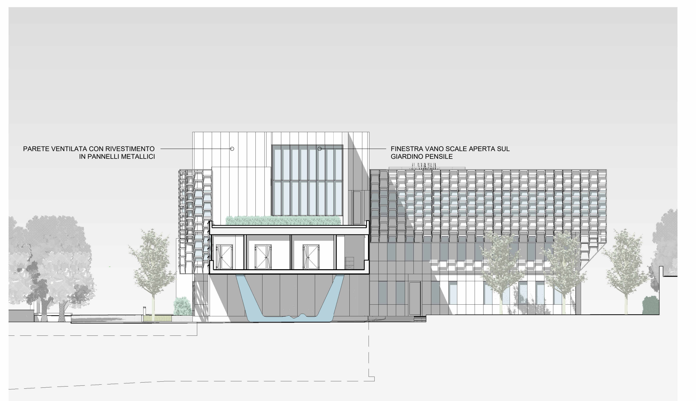
SEZIONE C - PONTE DI COLLEGAMENTO Scala 1:200