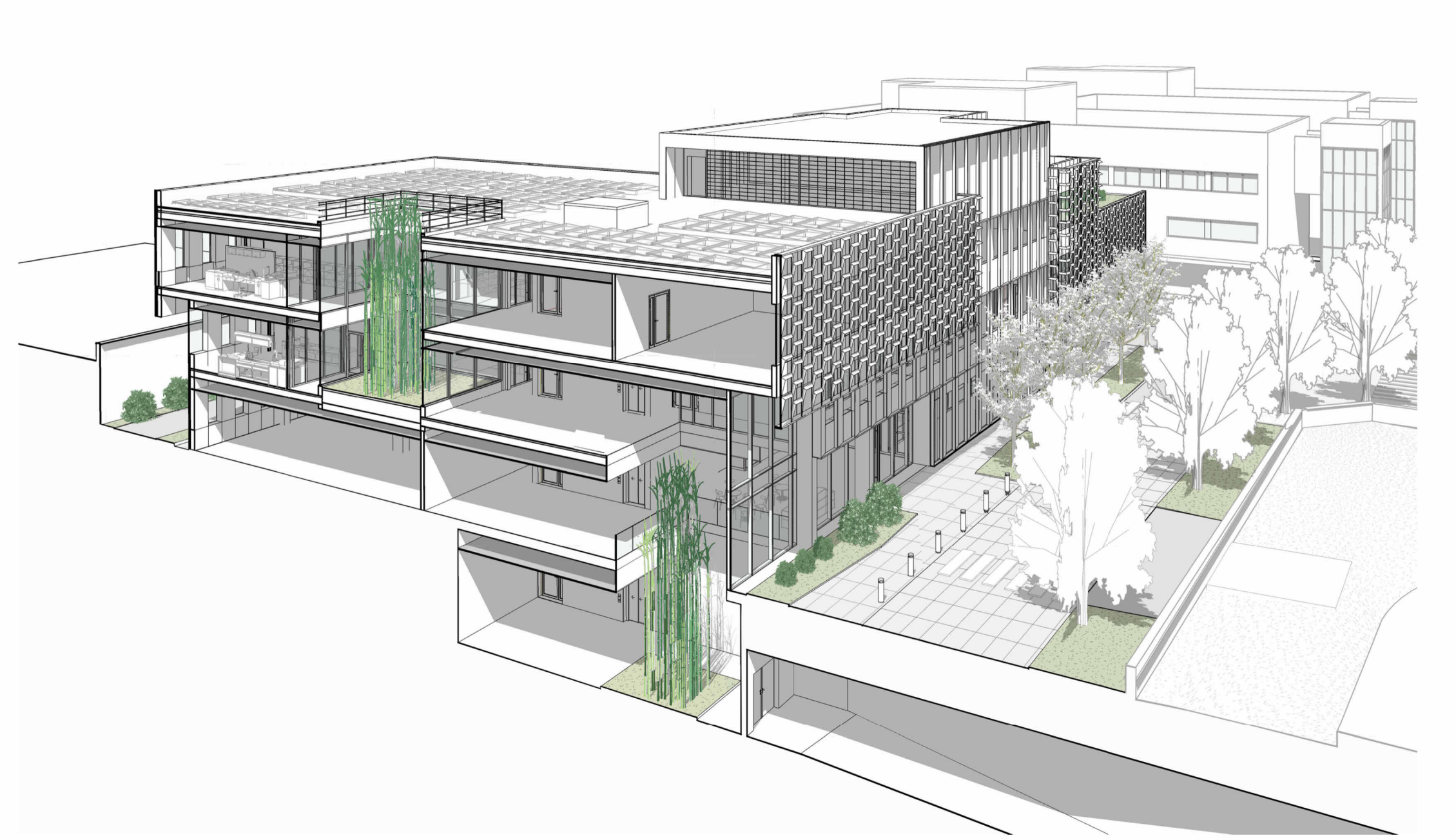
PROSPETTIVA SPACCATA SU CORTE, ATRIO E TUNNEL DI COLLEGAMENTO