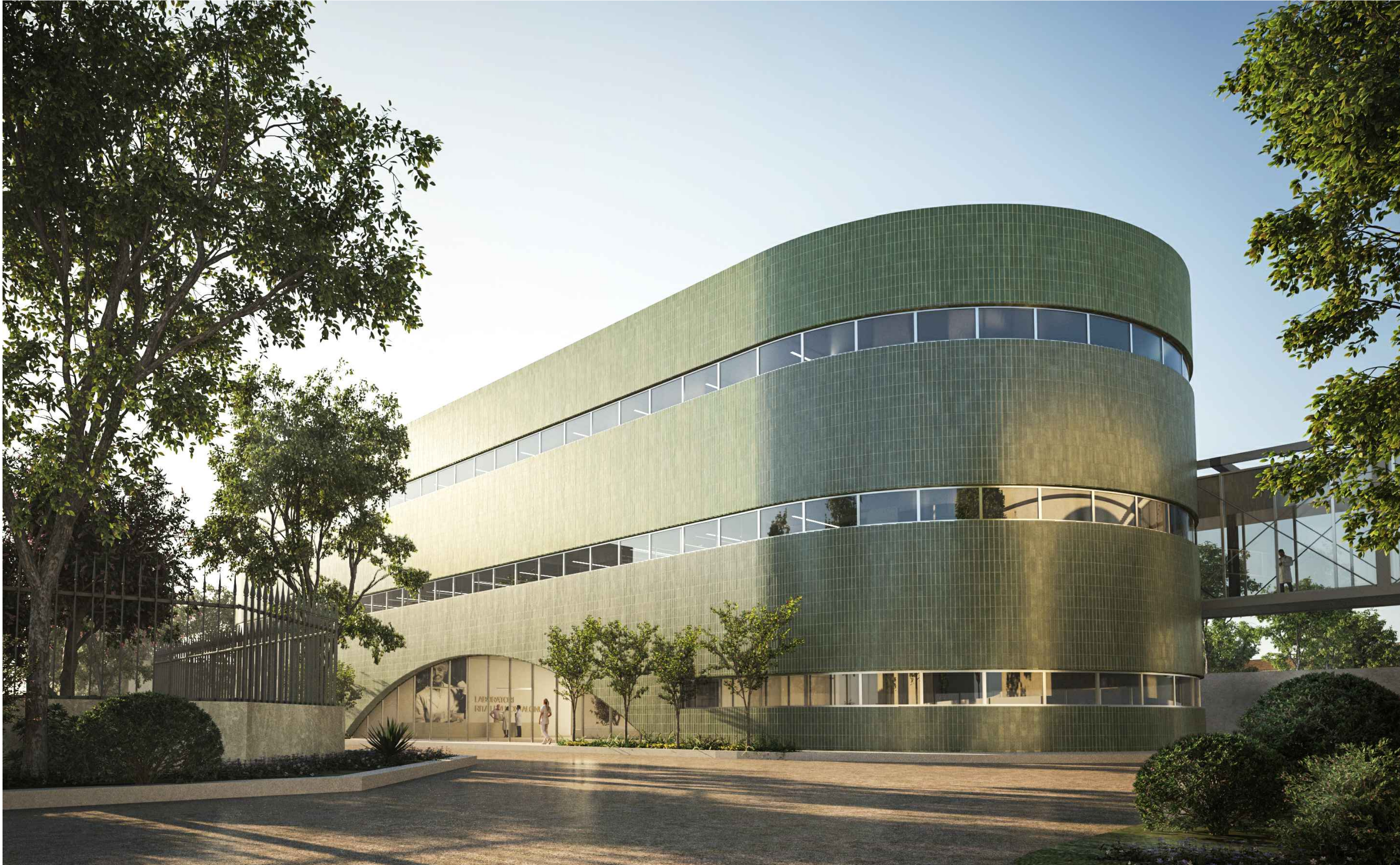
Vista renderizzata - Ingresso principale Corpo A