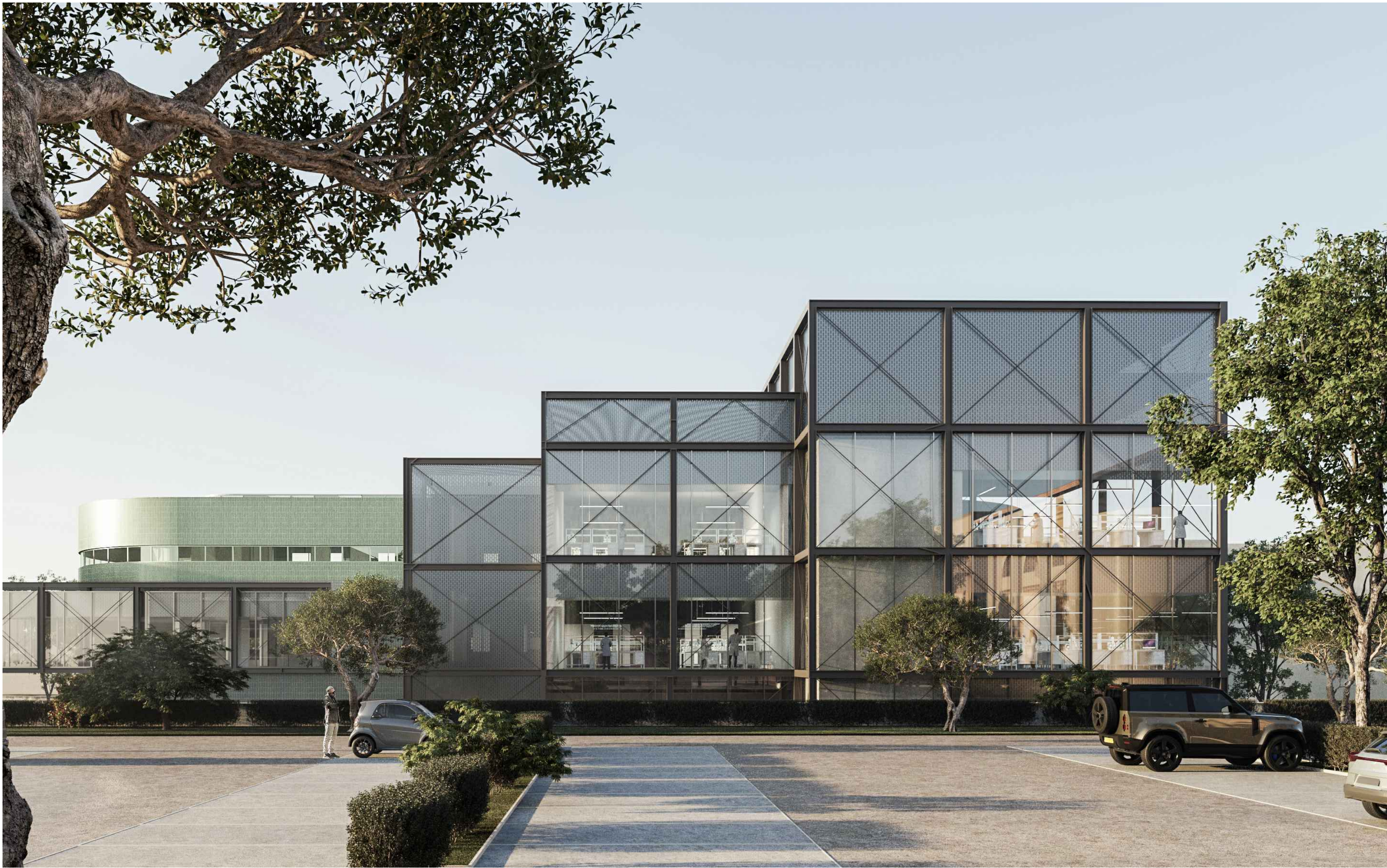
Vista renderizzata - Corpo B