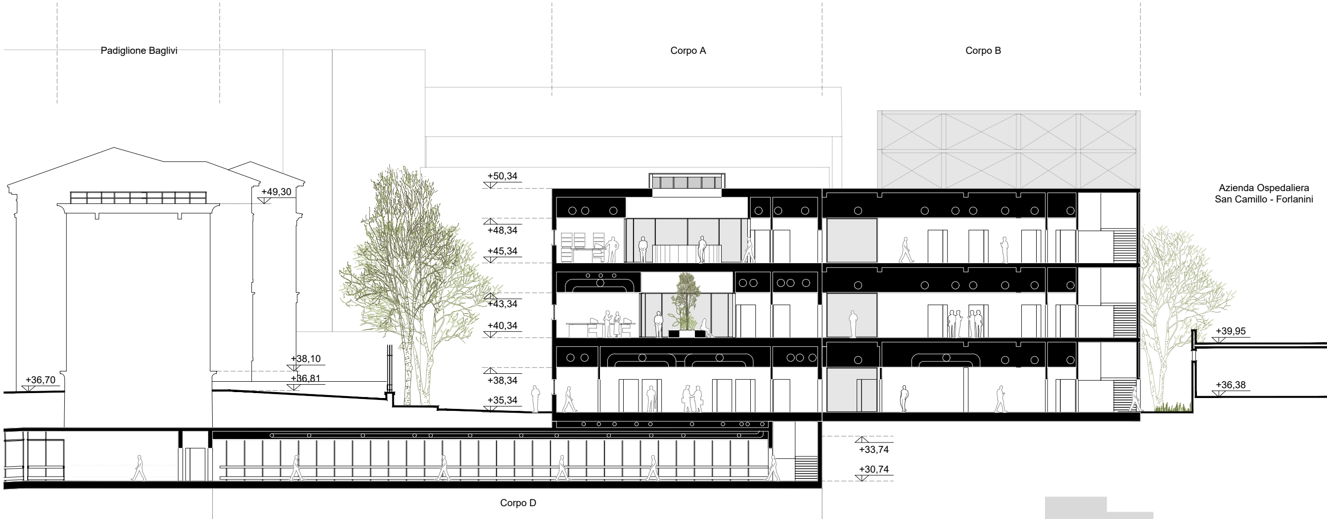
Sezione B-B' - Scala 1:250