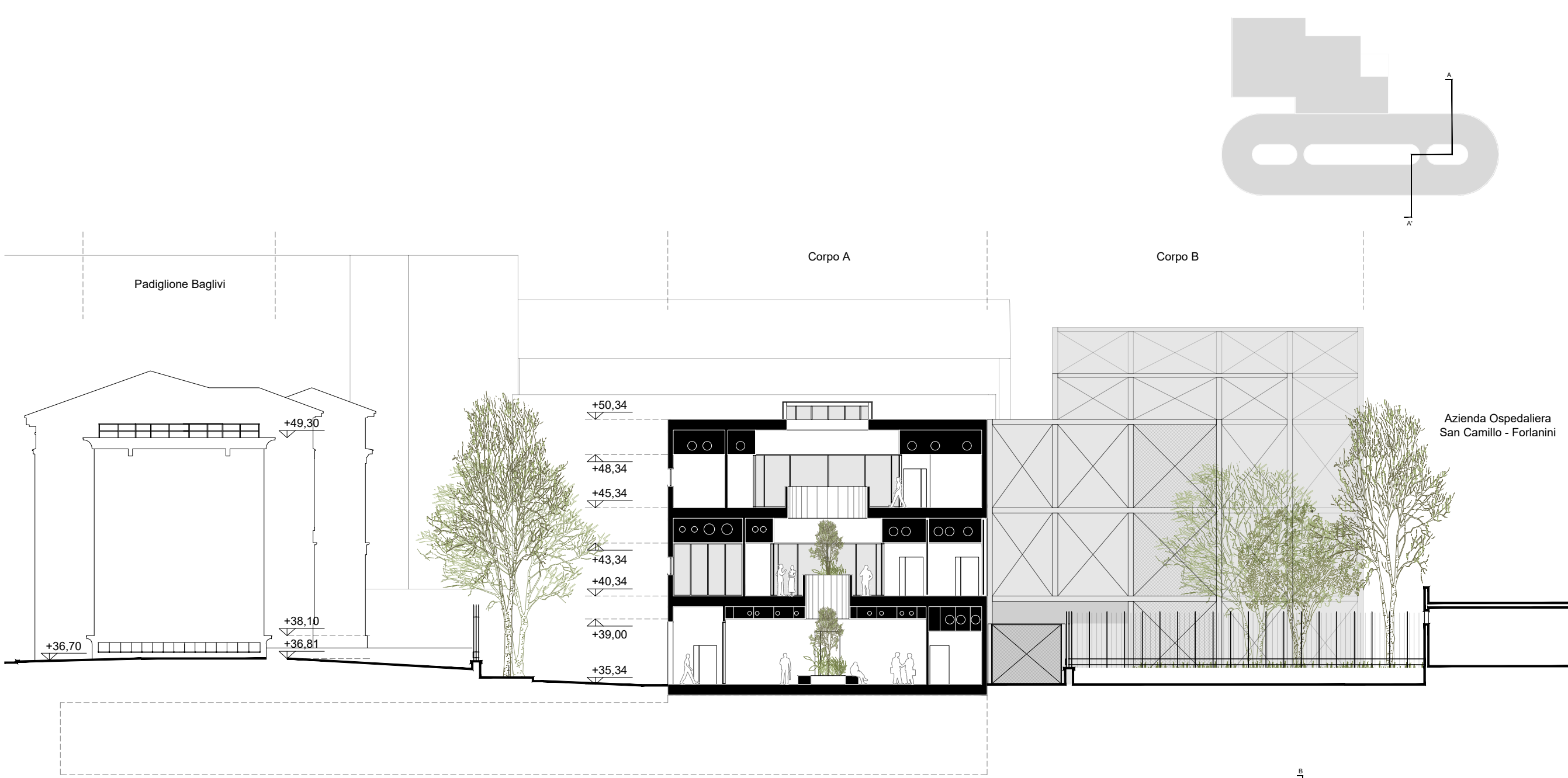
Sezione A-A' - Scala 1:250