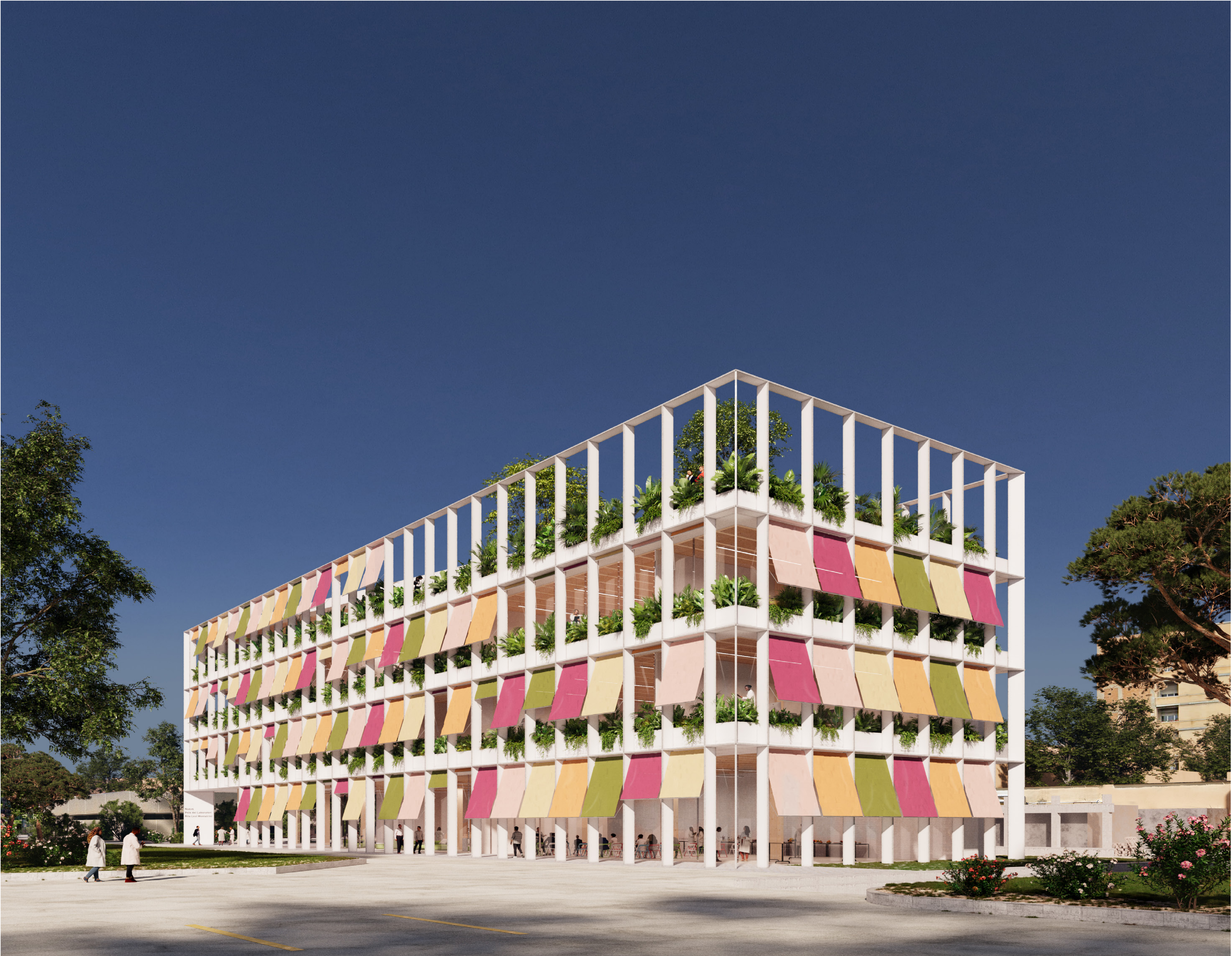
Vista della facciata Sud-Est dell'edificio del Nuovo Polo dei Laboratori Rita Levi Montalcini all'interno del Campus IRCCS Spallanzani