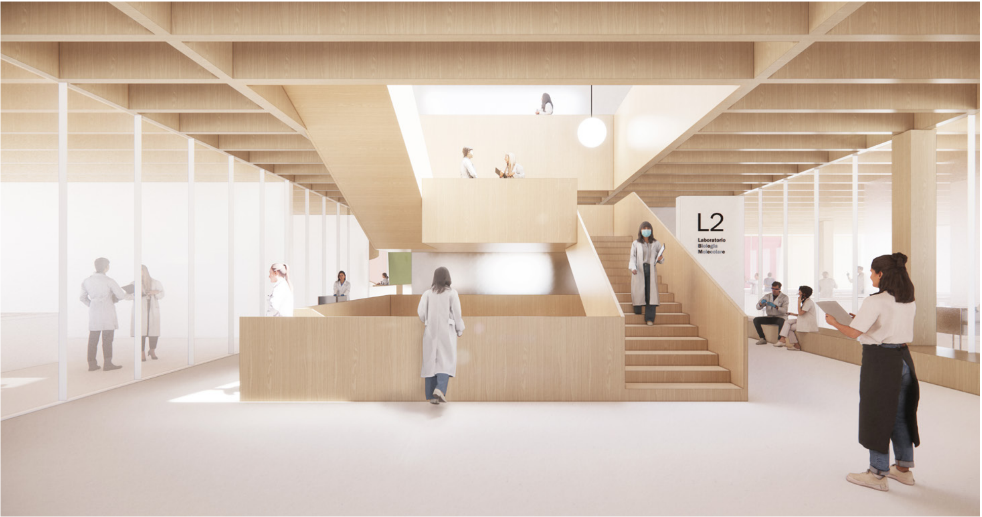
Vista dell'atrio al piano secondo con la scala, le piattaforme a mezza altezza e le aree collaborative informali