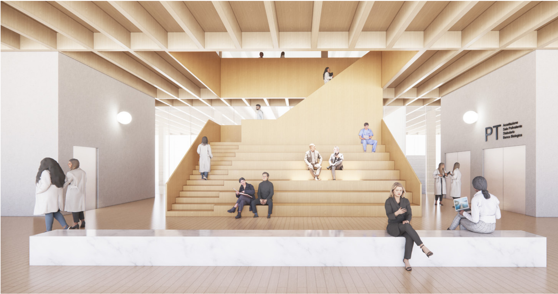
Vista della Sala d'Ingresso al piano terra con la scala - anfiteatro dell'atrio in primo piano